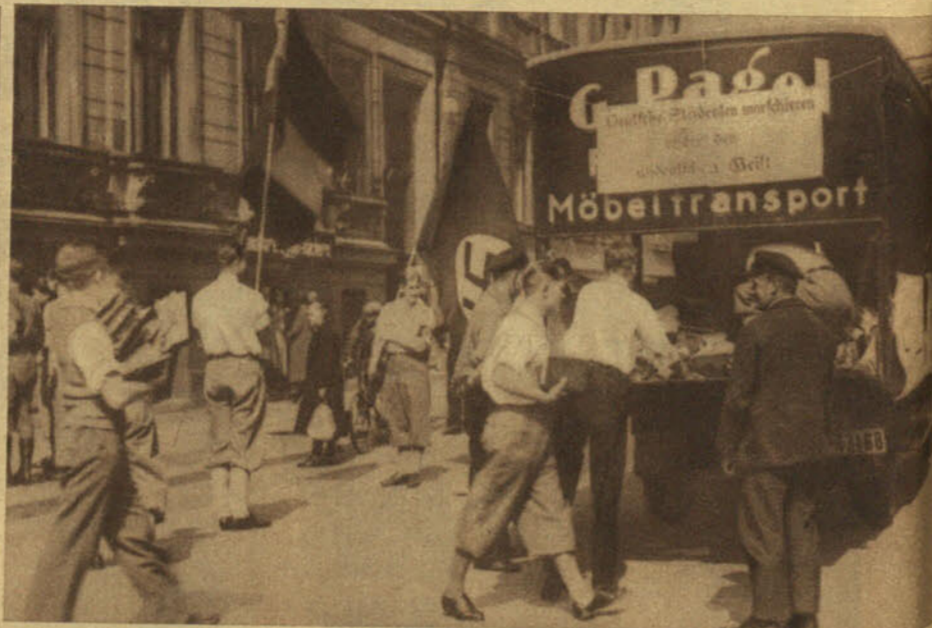
Durante una semana, los jóvenes hitlerianos, con sus grandes banderas y sus camiones, han ido por las librerías, las bibliotecas públicas y los gabinetes de lectura cogiendo los libros antialemenes. ¿Cuáles son los libros antialemenes? Los libros antinacionalistas: toda la literatura pacifista, democrática, socialista, liberal y republicana