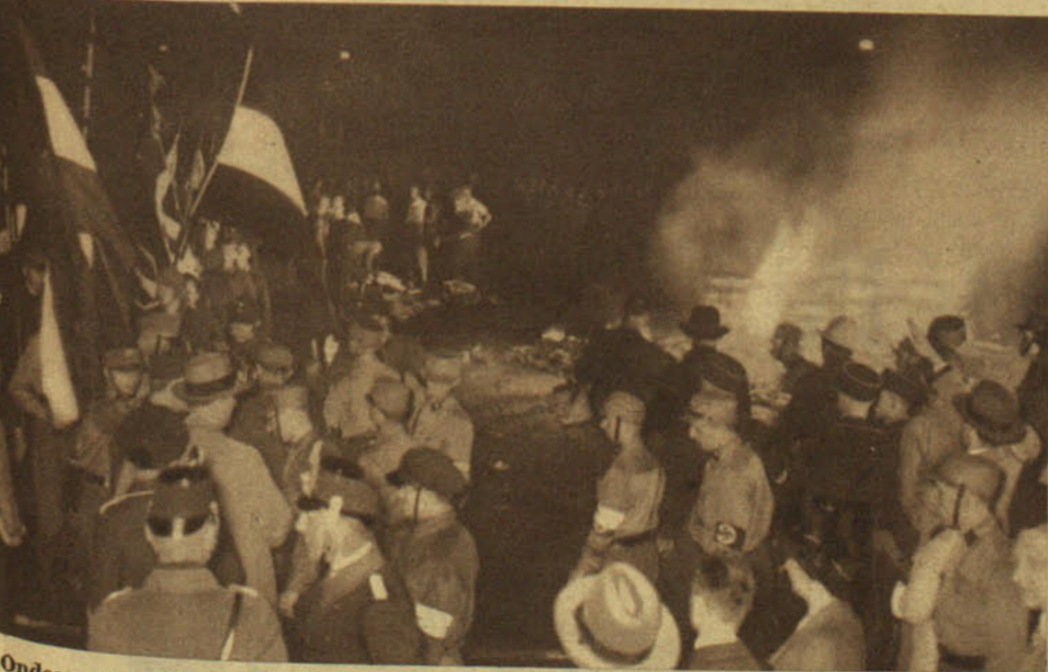
Ondean triunfales las banderas del Imperio, mientras los pobres volúmenes crepitan en la hoguera. La muchedumbre, transfigurada, entona sus himnos patrióticos con un fervor religioso que recuerda los salmos de los templos. La conciencia alemana, purificada, va a lanzarse a la conquista del Mundo, a cumplir la misión providencial que le está reservada