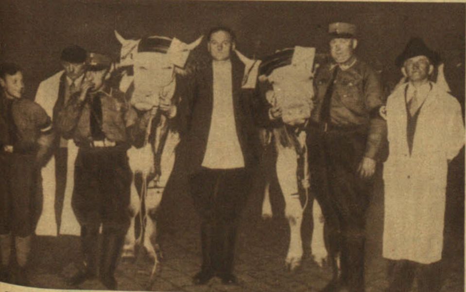
Como en el año 1000, los reos han ido a la hoguera rodeados de la befa popular. Los inquisidores de hoy no han querido que en su auto de fe faltase siquiera la simbólica coraza. En la quema de libros efectuada en Francfort, a imitación de la de Berlín, los carros cargados de libros iban arrastrados por bueyes que lucían leyendas grotescas y ultrajantes