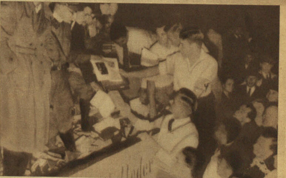
En la plaza de la Opera, ante las estatuas de emperadores y filósofos, se ha formado la pira, y los verdugos van sacando a sus víctimas de los camiones y van arrojándolas al fuego. Veinte mil volúmenes, recogidos en setecientas librerías y bibliotecas de Berlín, han caído en la hoguera purificadora encendida por el fervor inquisitorial del nacionalsocialismo