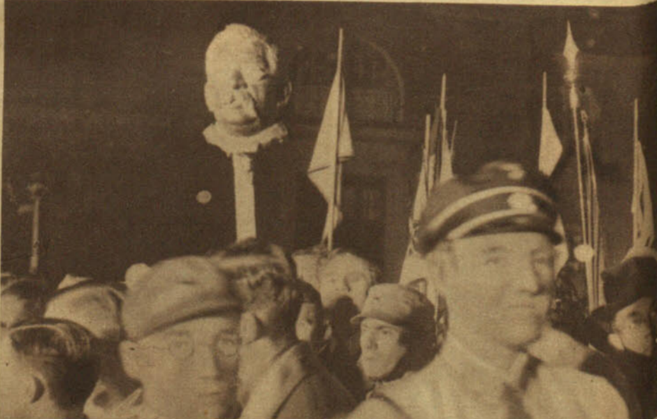
No basta con quemar los libros y aventar las cenizas. Algunos autores relapsos van a ser quemados también en efigies; así, Emil Ludwig; así, este profesor inmoral de sexología, el doctor Magnus Hirschfeld, cuyo busto conduce la tropa de "nazis" a la hoguera con el mismo ademán triunfal con que hubiesen llevado su odiada cabeza clavada en una pica