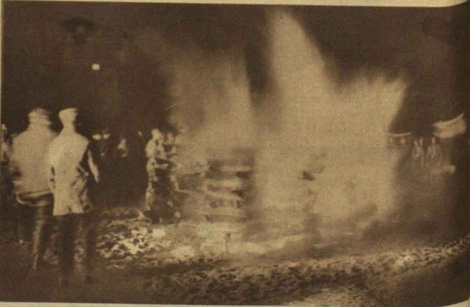
Estos libros malditos no hablarán más. Ya no repetirán nunca sus palabras desalentadoras para la juventud. Una densa y negra humareda se alza de la pira gigantesca, y con ella parece crecer y llegar al cielo la fé de los alemanes en sí mismos, su fervor patriótico, su mística nacional, su espíritu combativo. "Deutschland, Deutschland über alles...!"