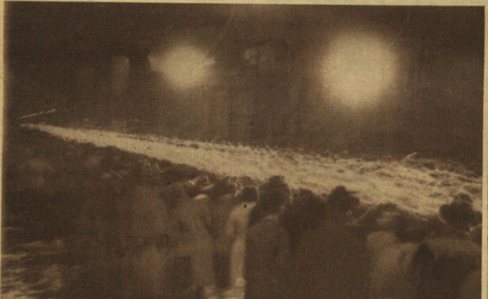
Para edificación del pueblo, el cortejo medieval que conduce a la hoguera va atravesando las calles principales de la gran ciudad a la luz incierta de los hachones. Sobre los camiones donde van las obras de Wells, Ludwig, Remarque, Sforza, Gorki y tantos otros, ondean unas banderas con la cruz svástica que evocan la fatídica cruz verde de la Santa Inquisición