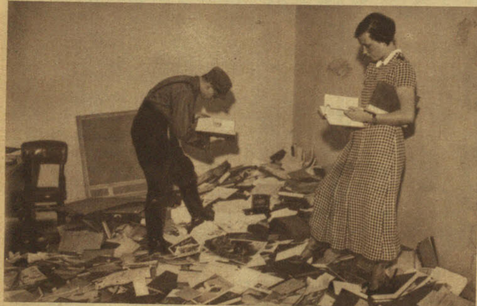
"La cólera vengadora del espíritu alemán ha despertado"—dicen—. Y el Comité de acción de los estudiantes hitlerianos ha resuelto que la primera manifestación de esa cólera casi divina sea una quema general de libros perniciosos. Este bizarro "nazi" y esta audaz "gretchen" van a decir al Mundo qué es lo que del pensamiento humano merece salvarse