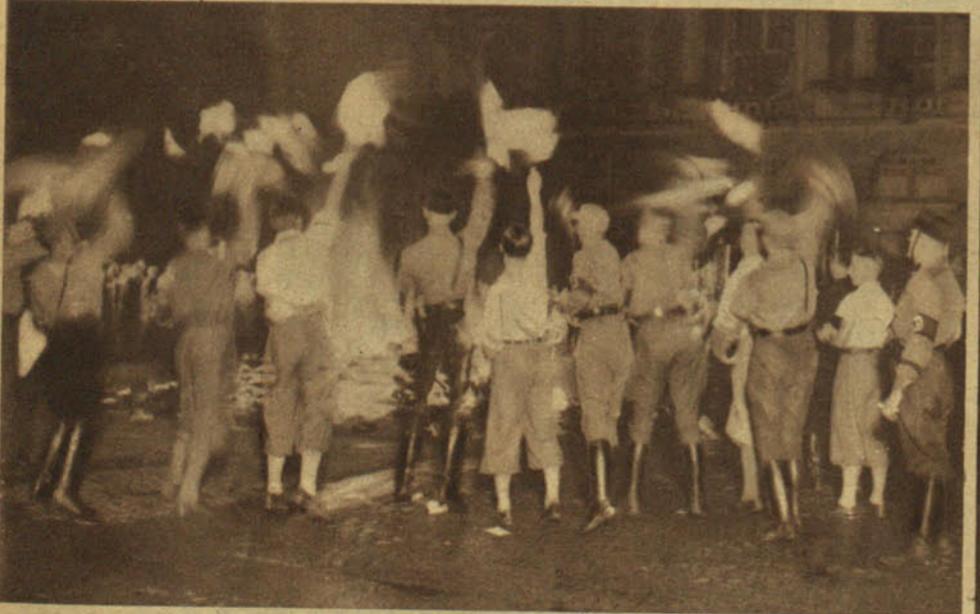
¡Al fuego! ¡Al fuego! Los jóvenes "nazis", jubilosos, arrojan uno a uno los libros malditos a la gran hoguera. Allá van a ser devorados por el fuego los nobles pensamientos pacifistas, junto con los bajos halagos al instinto; la pornografía y la espiritualidad; la bella frase y la imagen feliz y la facecía y la imprecación. ¡Todo arde ya en una sola llama!