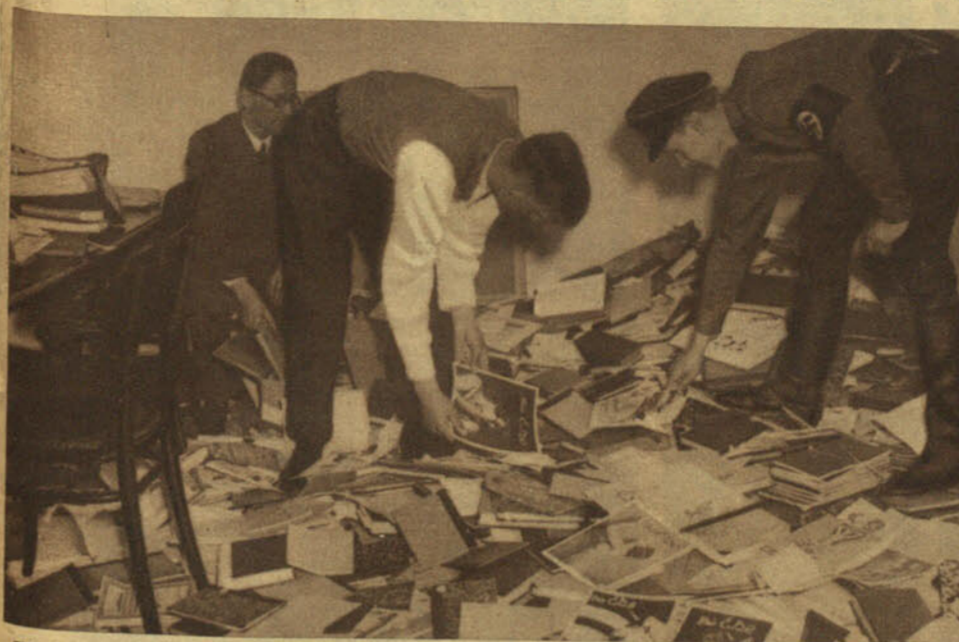
El joven nacionalista alemán quiere ser casto y puro. Su reacción frente a la corrupción ambiente le ha hecho revolverse contra los libros pornográficos y contra toda esa literatura pseudocientífica de la psicología sexual. Al sentir bajo sus altas botas claveteadas los libros pornográficos, se hace la ilusión de estar pateando sus propios pecados