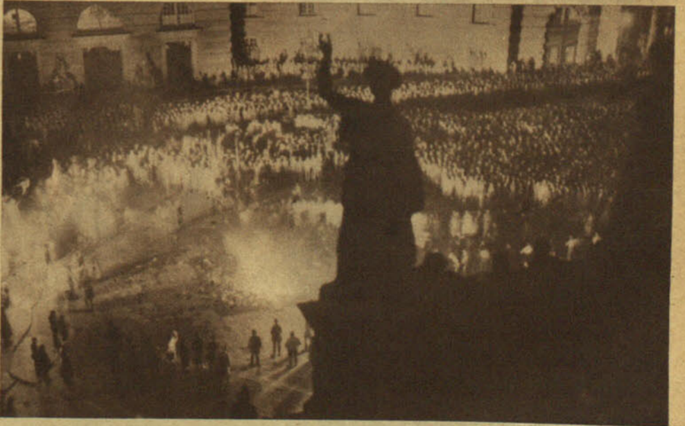
El gran inquisidor de Alemania, el minúsculo y terrible doctor Goebels, asoma su cara lívida entre los haces de luz de los reflectores, y mientras sus tropas, delirantes de entusiasmo, patean el rescoldo y aventan las cenizas de los libros malditos, explica el valor simbólico del auto de fe realizado. "El espíritu liberal ha muerto", dice sencillamente

MAÑANA: El lugarteniente de Hitler y actual ministro del Gobierno alemán, doctor Goebels, habla expresamente a los lectores de AHORA Lo que piensa el líder más destacado del nacionalsocialismo sobre la posibilidad de un movimiento análogo al de Alemania en toda Europa, y, por lo tanto, en España.