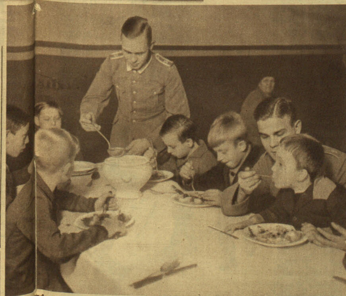
La propaganda del militarismo es cada vez más intensa. En los cuarteles no sólo se organizan las grandes manifestaciones en favor de los "sin trabajo", sino que a los hijos de éstos se les da de comer por la mano el alma de los oficiales que algún día les llevarán gozosos a la lucha por el ideal de la Gran Alemania