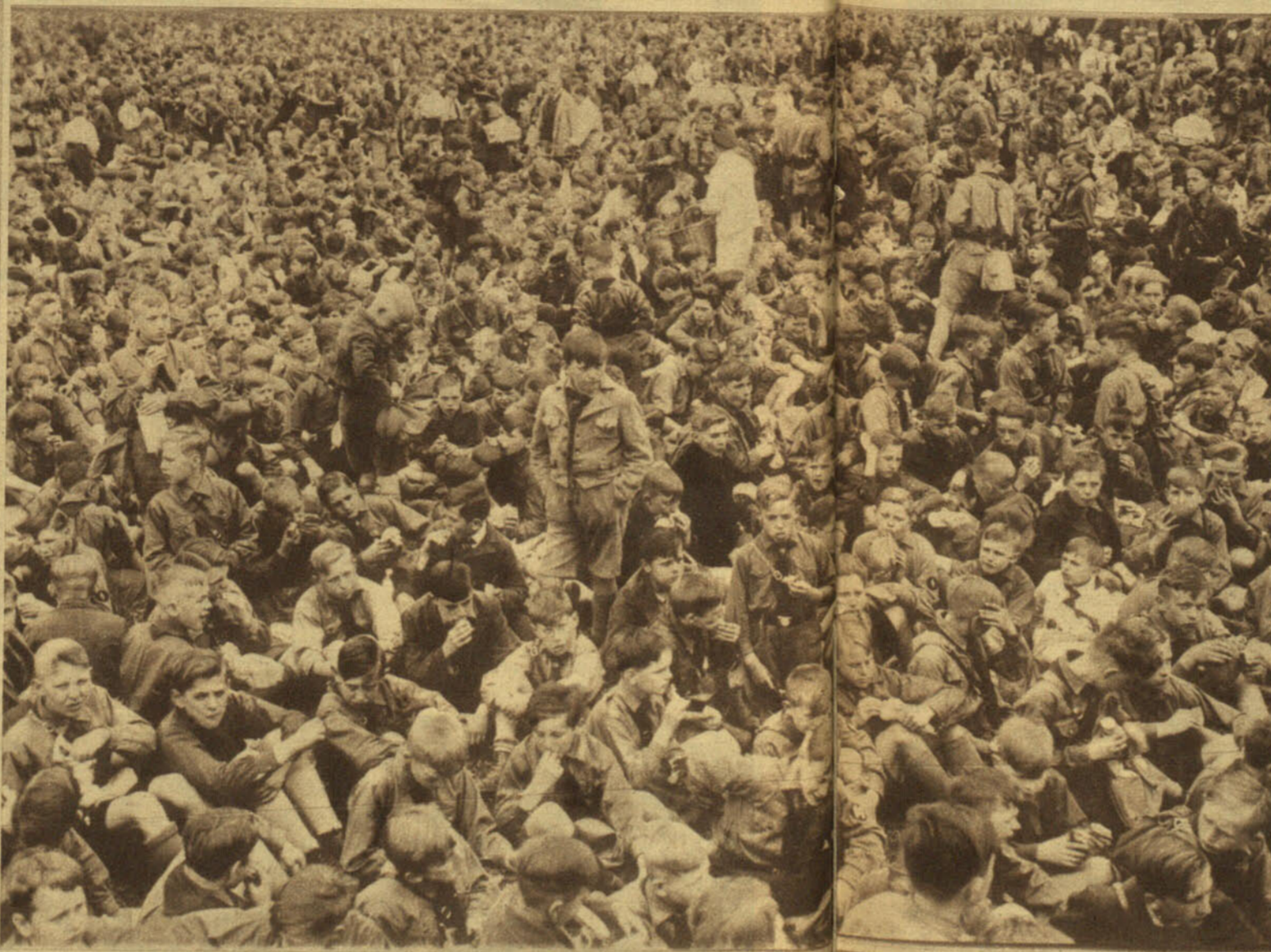
Los nacionalsocialistas hacen frecuentemente grandes movilizaciones infantiles. Miles y miles de inocentes criaturas, atraídas por el aparato brillante del partido—las charangas, las antorchas, los uniformes—, forman en las grandes paradas del hitlerismo

Hay que tener un poco de imaginación para comprenderlo. Imaginemos que el