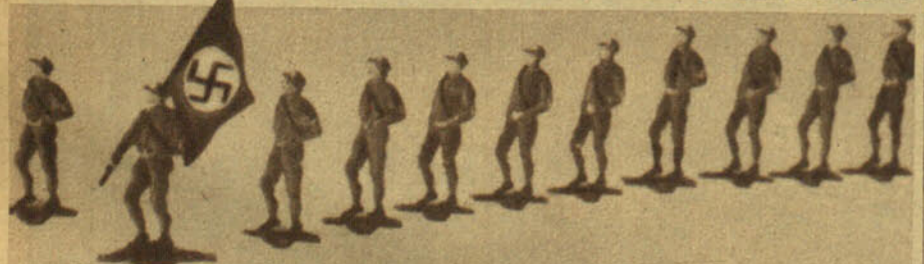
Los soldados de plomo se han convertido en "nazis" de plomo. En tanto llega la ansiada hora de jugar a los soldados de verdad, los niños alemanes se entretienen en imaginar las brillantes "acciones" de las tropas de asalto de Hitler