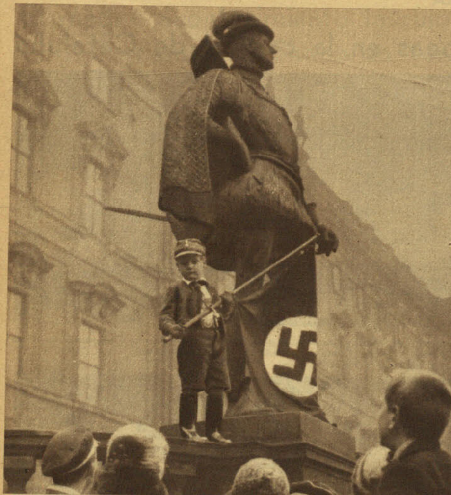
La conquista del niño es la principal preocupación de los hitlerianos, que han sabido cultivar hábilmente el gusto infantil por los uniformes como un medio más de propaganda. Todos los niños alemanes quisieran tener, como este diminuto "nazi", un uniforme de "camisa parda" y una bandera con la cruz svástica

(DE NUESTRO ENVIADO ESPECIAL EN ALEMANIA)