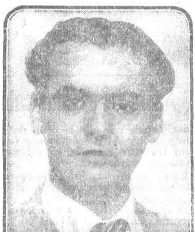
Federico García Lorca.

darme de la injusticia social, ni de la estupidez humana, ni de la pálida visión de los ajusticiados. Para edificar en cada minuto—¡el aire como base!—una nueva vida, distinta, huérfana, desarraigada, que no se pareciera—que no recordara—la existencia del minuto anterior. Una vi-